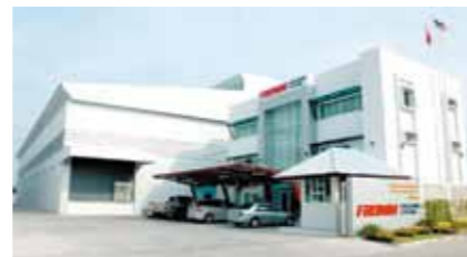
Fábrica de cintas poliéster STARstrap™ na Tailândia