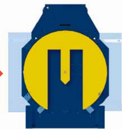
Prato giratório em ferradura com 3 posições de carregamento