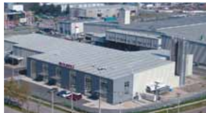
Fábrica de cintas poliéster STARstrap™ na Chile