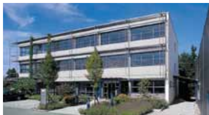
Centro de Investigação & Desenvolvimento na Alemanha