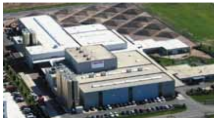
Fábrica de cintas poliéster STARstrap™ na Alemanha