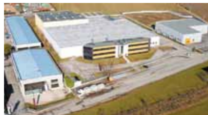
Fábrica de ferramentas e máquinas de cintar em Itália