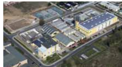
Fábrica de reciclagem de poliéster na Alemanha