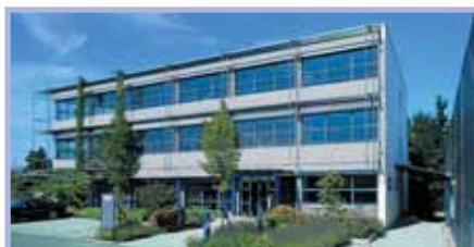
Onderzoeks- en ontwikkelingscentrum

FROMM Holding AG ontwerpt, ontwikkelt en produceert een complete lijn verpakkingsmachines en apparatuur voor het wikkelen, bundelen en omsnoeren van allerhande pakketten, dozen en pallets. Meer specifiek: handapparatuur en (automatische) machines voor het omsnoeren met staal- of kunststofband en (pallet) foliewikkelmachines evenals het wereldwijd gepatenteerde Airpad™ luchtkussensysteem. Opgericht in 1947, zijn er momenteel bij het familiebedrijf wereldwijd meer dan 550 mensen werkzaam. 20 dochterondernemingen en meer dan 50 gespecialiseerde partners zorgen gezamenlijk voor een eenduidige efficiënte service en klantenondersteuning. Traditionele waarden zoals continuïteit, onafhankelijkheid en betrouwbare kwaliteitsproducten vormen de leidraad voor de bedrijfspolitiek en zijn het fundament onder het langjarige succes.