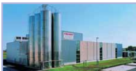
Productie van Airpad™ folie en Polyesterband

In de FROMM fabriek wordt 24 uur per dag geproduceerd. Hoog gekwalificeerde teams van specialisten produceren met behulp van computergestuurde machines de FROMM kwaliteitsproducten. Alle handapparaten en machines worden, voordat ze worden ingepakt en verstuurd, uitvoerig getest. De FROMM productie is ISO 9001 gecertificeerd.