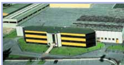
Productie van handapparaten en machines

In het FROMM onderzoeks- en ontwikkelingscentrum werken ervaren ingenieurs constant aan de ontwikkeling van nieuwe technieken en producten. Daarbij maken ze gebruik van de nieuwste 3D CAD/CAM technologie. Door een continue proces van aanpassingen in testprocedures en apparatuur wordt de erkend hoge kwaliteit van FROMM producten gegarandeerd en verzekerd voor de toekomst.