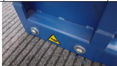
Fig.7 Fix sideways the mast to the base with the 2 screws and 2 washers. Fissare lateralmente la colonna alla base con le 2 viti e 2 rondelle.