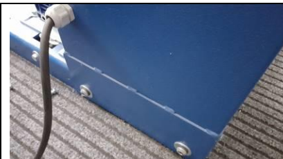
Fig.8 Fix rear the mast to the base with the 2 screws and 2 washers. Fissare dietro la colonna alla base con le 2 viti e 2 rondelle.