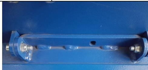
Fig.4 Fix the mast to the base with the 2 screws, 4 washers and 2 nuts provided. Fissare la colonna alla base con le 2 viti, 4 rondelle, e i 2 dadi di dotazione.