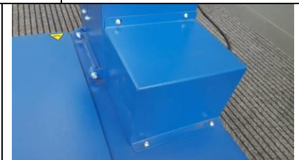
Fig.9 Cover motorgear group. Coprire il gruppo motoriduttore.