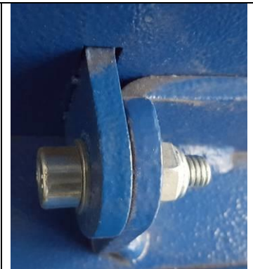
Fig.5 ...Detail. ...Dettaglio.